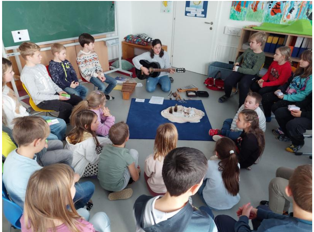
Součástí programu společného setkání lipenských dětí s jejich protějšky z rakouské školy z obce St. Stefan am Walde, které proběhlo 15.12.2025, bylo i společné zpívání.

Děti z obou základních škol se poprvé vzájemně seznámily na zahradě, kde si společně zahrály fotbal a proběhly se. Následovalo oficiální a milé přivítání jak ze strany ředitel-