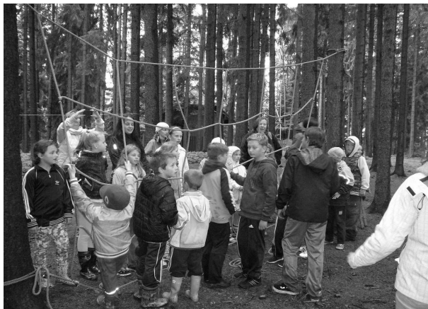
Olympiáda lipenských kmenů