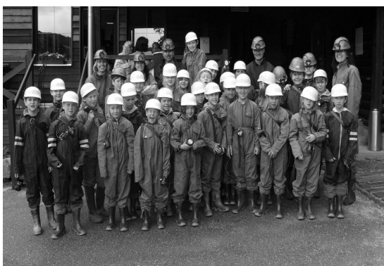
Školní výlet – návštěva grafitového dolu