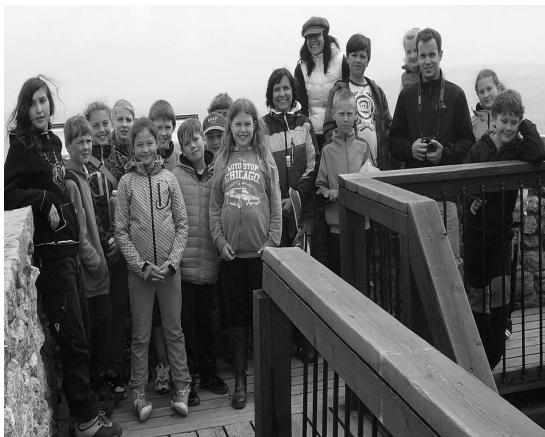
Výukový seminář „Klíč“ na Svatém Tomáši

MILÉ DĚTI A ŽÁCI NAŠÍ ŠKOLY, PŘEJEME VÁM KRÁSNÉ PRÁZDNINY PLNÉ POHODY, NEVŠEDNÍCH ZÁŽITKŮ A PŘÍJEMNÉHO ODPOČINKU!!!!!!!!!!!!!!