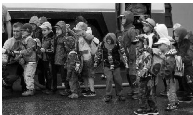
Výlet mateřské školy do Frymburku

Více fotografií z akcí Základní a Mateřské školy Lipno nad Vltavou naleznete na http://skolalipno.webnode.cz/ ( http://skolalipno.rajce.idnes.cz/ ).