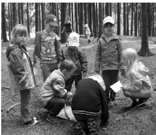
Cesta k pirátům